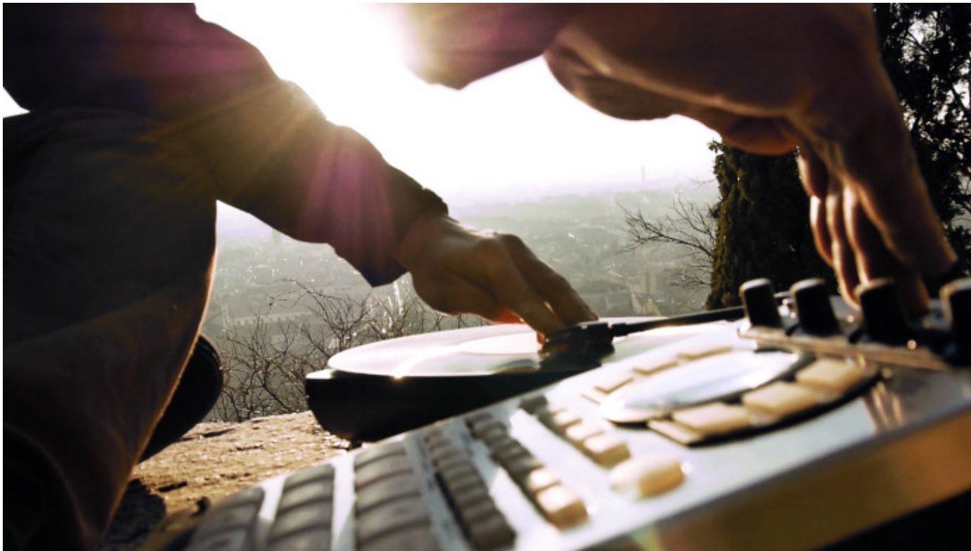
B:Eat, il nuovo format di MVAsounds & Televisione Pirata